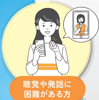
聴覚や発話に 困難がある方