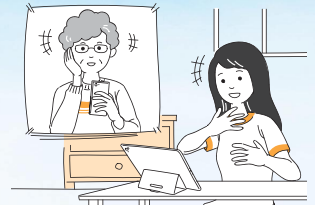
●家族や友人との会話